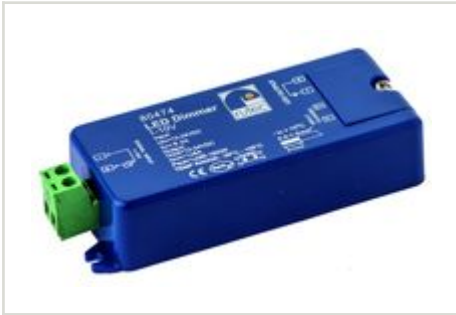
LED Dimmer 1-10V, Poti/Taster LED Dimmer 96W/12V-192W/24V Artikel-Nr.: PHZ474